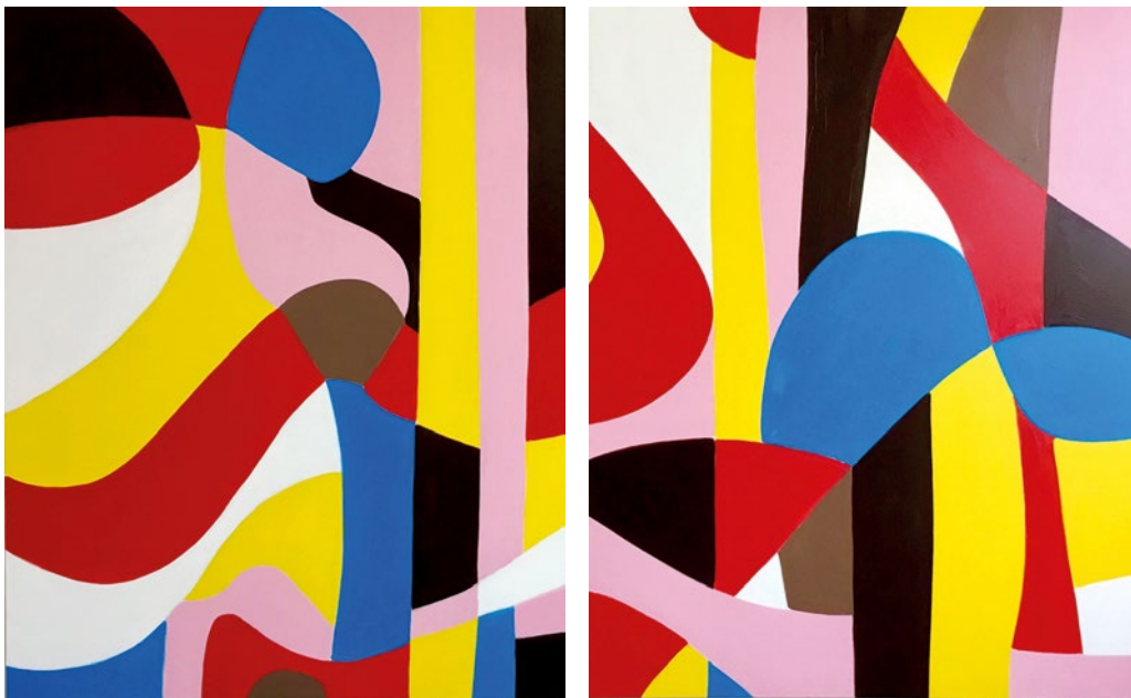
Andrea Thoma www.andreathoma.com Folded Colour / Flamenco, Diptychon, 2019. Öl auf Leinwand, je 100 x 80 cm.